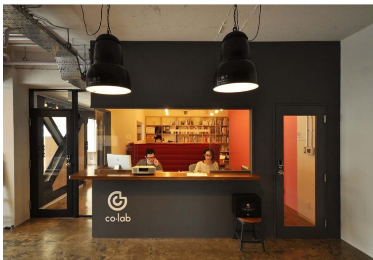
co-lab代官山エントランス

現在、ファッションメディア【itSnap】【itSnapMagazine】では事業拡大につき、さらに一緒に盛り上げていってくれるメンバーの募集を開始しました！